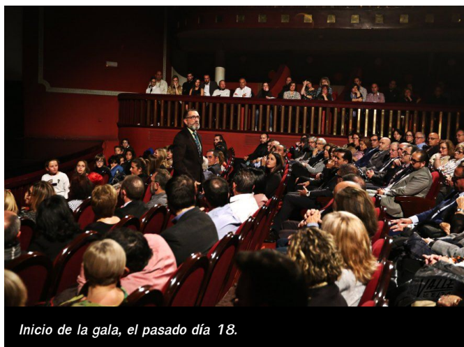
Inicio de la gala, el pasado día 18.