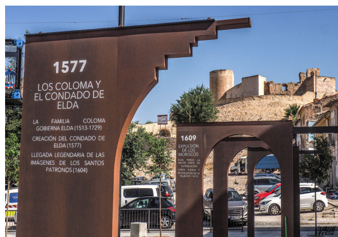
Los arcos recogen la historia de Elda.

Parte de la corporación municipal estará presente en este acto, PSOE, Esquerra Unida y Ciudadanos ya han confirmado su presencia. El Partido Popular, sin embargo, ha anunciado que no acudirá a este acto.