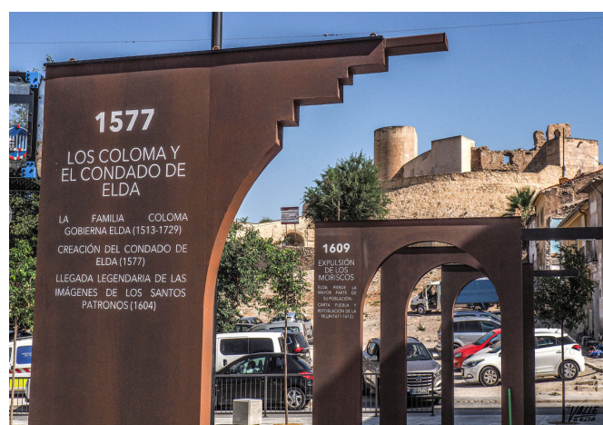
Los arcos recogen la historia de Elda.

Parte de la corporación municipal estará presente en este acto, PSOE, Esquerra Unida y Ciudadanos ya han confirmado su presencia. El Partido Popular, sin embargo, ha anunciado que no acudirá a este acto.