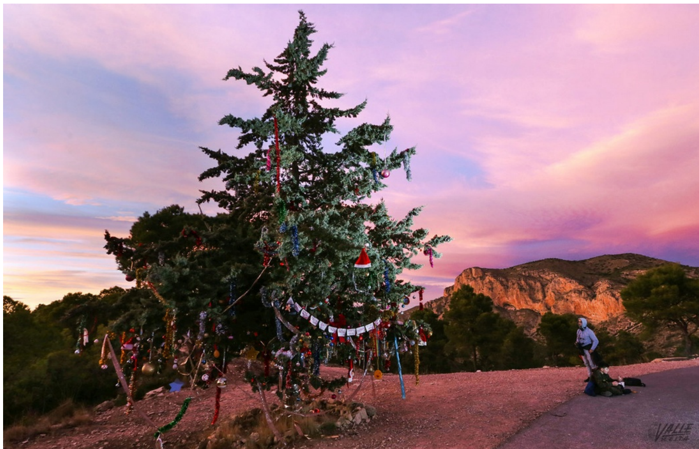
El atardecer dejó ayer una bonita estampa.

Decenas de personas de Elda y Petrer subieron al Cid ayer para cumplir con lo que se ha convertido en una costumbre en el último domingo del año. La afluencia de visitantes fue menor debido a que los ciudadanos se repartieron entre los diferentes parajes de ambos municipios con el objetivo de evitar las aglomeraciones que se producían en la montaña cada fin de año.