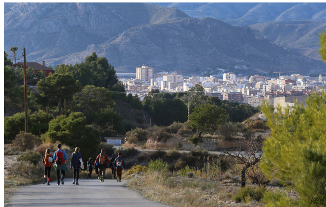
El próximo jueves se espera que la población vuelva a visitar los parajes.

El Ayuntamiento abrió ayer el parking de la Finca Ferrusa, con capacidad para unos 150 vehículos, y peatonalizó el camino hacia la Chabola del Forestal para evitar que se colapsara esa vía, una acción que repetirá el día 31 de diciembre, cuando también se espera la afluencia de numerosos ciudadanos del Valle y de la comarca dado que es uno de los parajes mejor valorados por los senderistas .