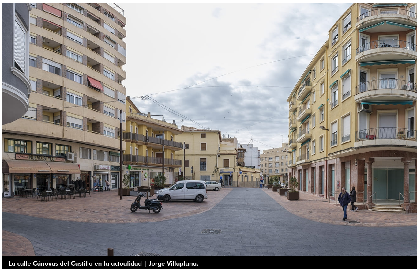
La calle Cánovas del Castillo en la actualidad.

En esta ocasión hablaremos de la calle Cánovas del Castillo, apuntando que, a mediados del siglo XVIII, el núcleo urbano de Petrer, situado en las laderas del castillo, tendría sus límites entre las actuales calles La Virgen (antiguo Portal de la Virgen), Cánovas del Castillo (antiguo Portal de San Roque), San Vicente y Agost-San Antonio. La población sería de unos 2.000 habitantes.