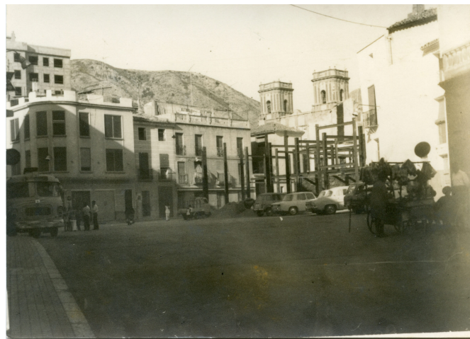
El edificio Maracaibo en su fase inicial de construcción

El político e historiador Antonio Cánovas del Castillo, nació en Málaga en 1828 y falleció en el balneario de Santa Águeda, en Mondragón (Guipúzcoa) en 1897. En 1845, se trasladó a Madrid y cursó estudios de Derecho y se inició en la actividad política como hombre de confianza del militar y político Leopoldo O'Donnell y redactó personalmente el manifiesto de Manzanares en el que se solicitaban reformas políticas. En 1858 estuvo al frente de la Dirección General de la Administración, bajo el ministerio de Posada Herrera. El movimiento revolucionario que finalizó con el derrocamiento de Isabel II, en 1868, supuso su retrainimiento político, aunque proclamó la candidatura del príncipe Alfonso de Borbón al trono de España. En enero de 1884 volvió al Gobierno, pero la muerte de Alfonso XII, a fines del mismo año, motivó su dimisión para que la regente pudiera llamar al poder a Sagasta. En 1890 volvió al poder, llevando como ministro de Gobernación a Silvela, cuyos actos provocaron la caída del Gobierno en 1892. En marzo de 1895 asumió de nuevo la Presidencia del Consejo de ministros y, en agosto de 1897, cuando estaba descansando en el balneario de Santa Águeda, fue asesinado por un anarquista italiano.