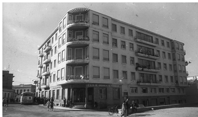
Confluencia Cánovas del Castillo, San Bartolomé y solar que ocupa hoy la plaza del Derrocat

Tras la proclamación de la República, en la sesión plenaria de 27 de mayo de 1931, se propuso cambiar el nombre de la calle dedicada a Cánovas del Castillo por el del político y pedagogo Francisco Ferrer Guardia (Alella, 1859 - Barcelona, 1909), pero se trataba sin duda de un error en las actas municipales o un cambio de opinión, ya que Ferrer Guardia se le puso finalmente a la calle Castillo.