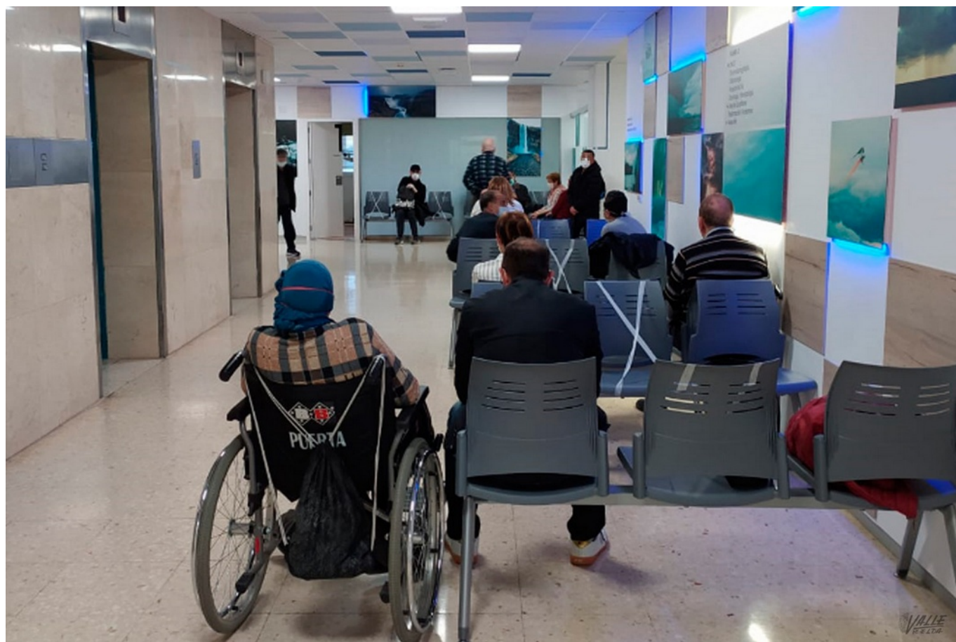
Imagen del hospital de Elda.

La situación de pandemia por la COVID-19, un virus desconocido y muy contagioso , unido a la escasez de equipos de protección como mascarillas y EPIS o trajes especiales, ha hecho que numerosos sanitarios se contagien en España, y Elda no es una excepción , pues más de veinte de ellos, sobre todo enfermeras y médicos, han dado positivo en las pruebas por coronavirus. Es posible que haya más infectados, pero los test para su detección se han agotado.