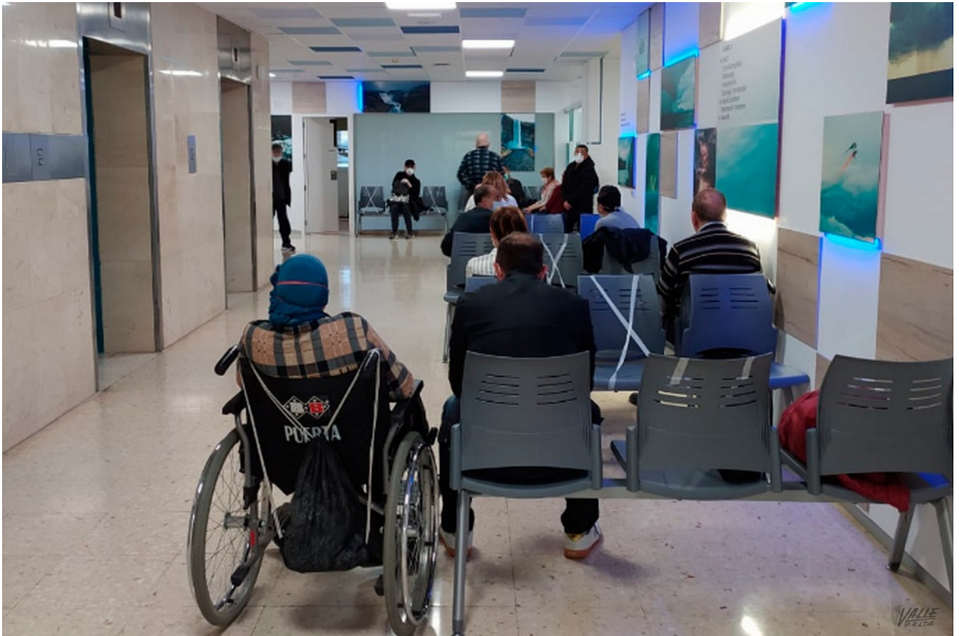
Imagen del hospital de Elda.

La situación de pandemia por la COVID-19, un virus desconocido y muy contagioso , unido a la escasez de equipos de protección como mascarillas y EPIS o trajes especiales, ha hecho que numerosos sanitarios se contagien en España, y Elda no es una excepción , pues más de veinte de ellos, sobre todo enfermeras y médicos, han dado positivo en las pruebas por coronavirus. Es posible que haya más infectados, pero los test para su detección se han agotado.