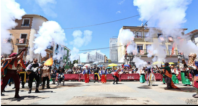
La última batalla ha sido entre los capitanes cristianos y moros