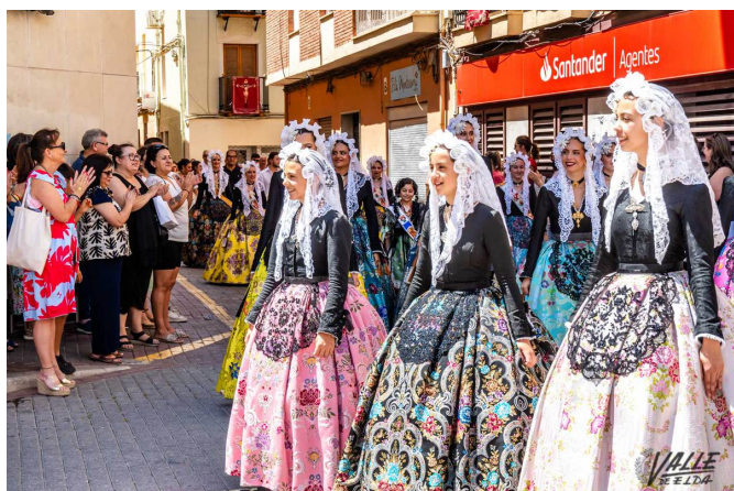
Las nueve candidatas han participado en el pasacalles | Nando Verdú.

de personas se han acercado al casco histórico de Petrer para aplaudir a las falleras.