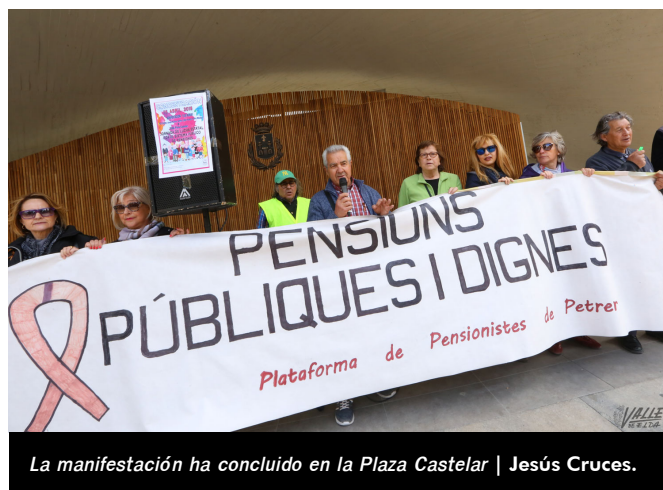
La manifestación ha concluido en la Plaza Castelar | Jesús Cruces.

La convocatoria ha estado respaldada en su mayoría por pensionistas pero también por jóvenes y trabajadores en paro. Su protestas tendrán continuidad a partir del próximo lunes con concentraciones a las 12 horas en las puertas de los ayuntamientos de Elda y Petrer, y aseguran que no pararán hasta conseguir sus objetivos .