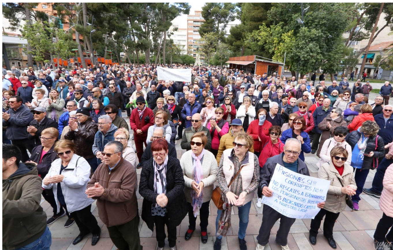
Los pensionistas han vuelto a tomar las calles de Elda y Petrer

Cerca de 1.300 personas han participado en la manifestación convocada por las Plataformas de Petrer y Elda en Defensa del Sistema Público de Pensiones. Los manifestantes han comenzado su recorrido a las 11:30 horas desde la avenida Reina Sofía de Petrer para terminar en la Plaza Castelar de Elda una hora más tarde.