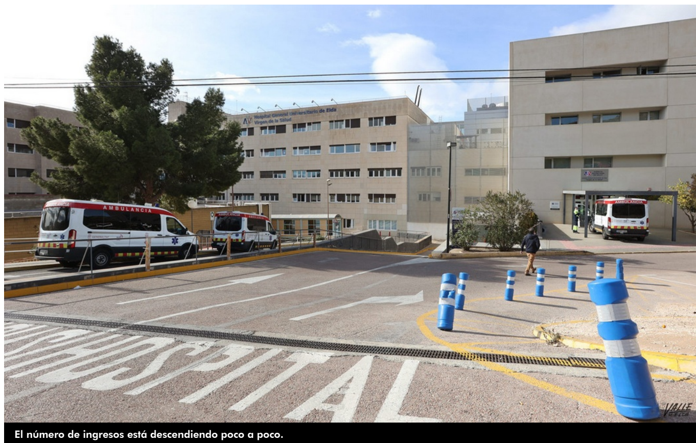
El número de ingresos está descendiendo poco a poco.

Los datos del Hospital General de Elda parecen reflejar la llegada a la llamada meseta de la curva de contagios de esta tercera ola . Desde que el pasado lunes 25 de enero se llegase al pico de ingresados COVID-19 con 300 camas ocupadas por coronavirus , la cifra ha ido descendiendo hasta situarse hoy en los 268 positivos ingresados . En las unidades UCI y de Reanimación hay 34 personas ingresadas por este virus más tres casos no COVID.