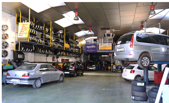
Neumáticos Jiménez e hijos se ubica en la Carretera de Monóvar.

Cabe destacar que las dos empresas disponen de avanzada tecnología como los sistemas de diagnóstico y mecánica, alineación y equilibrado computerizado en 3D , con lo que consiguen una mayor agilidad y precisión a la hora de trabajar. Otra de sus características es que cuentan con un stock de unos 3.000 neumáticos.