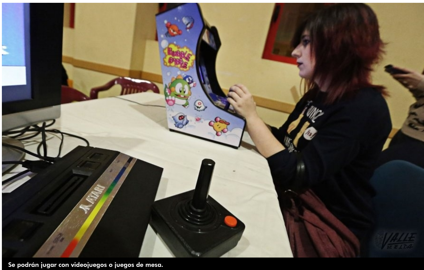
Se podrán jugar con videojuegos o juegos de mesa.