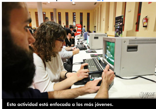
Esta actividad está enfocada a los más jóvenes.

Alejandro Ruiz señaló que para participar en cualquiera de las actividades, es necesario inscribirse a través del correo de la concejalía juventud@petrer.es .