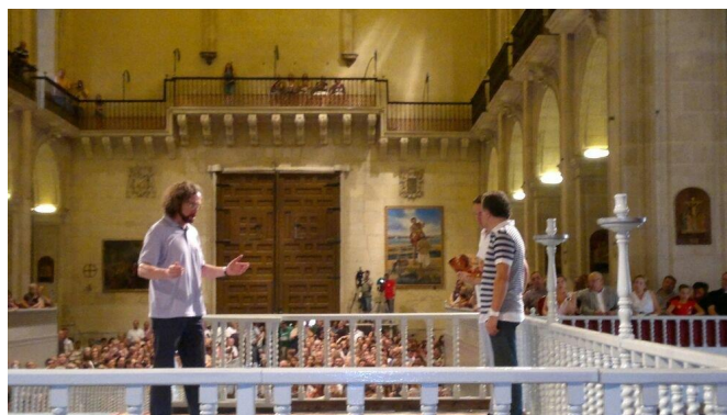
San Pedro y San Juan durante uno de los ensayos.

Desde la cúpula de la iglesia, que para las representaciones del Misterio se cubre con una lona pintada que simula el cielo, desciende un ángel en el interior de un aparato denominado Mangrana. Este ángel anuncia a María su cercana muerte y le entrega una palma dorada para que sea portada en su sepelio.