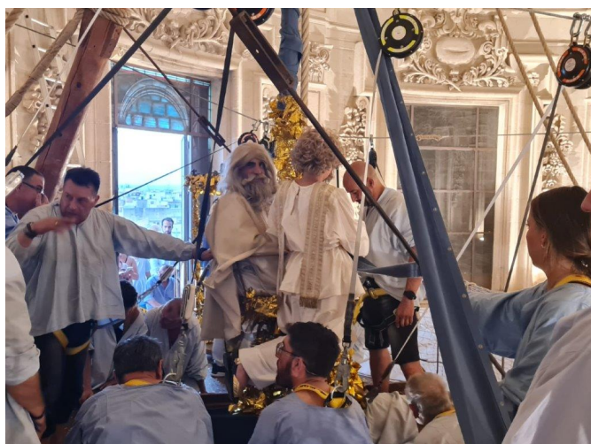
Situados ya en el aparato de la Coronación antes de abrirse las puertas del cielo.

resucitada. La ascensión de la Virgen es interrumpida por el apóstol Santo Tomás que le pide disculpas por su tardanza puesto que estaba predicando en la India lejana. Abierto de nuevo el cielo, hace su aparición otro aparato aéreo ocupado por la Santísima Trinidad. Entonces el Padre Eterno deposita sobre las sienes de la Virgen una corona imperial. María ha sido coronada como Reina de la creación. Y el canto emocionante del Gloria Patri, junto con el volteo de campanas, lanzamiento de cohetes y los aplausos de los numerosos espectadores, pone fin al Misterio de Elche.