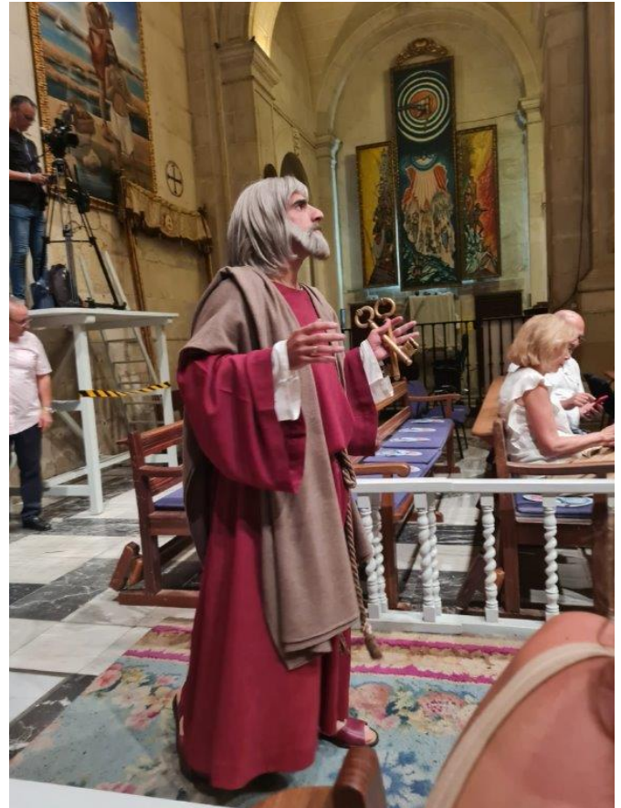
San Pedro, con gestos de asombro, ascendiendo por el andador durante la representación de la Vespra, en la que San Pedro va vestido de apóstol como los demás, identificándose por las llaves que lleva en la mano. Esa foto es de uno de los ensayos generales.