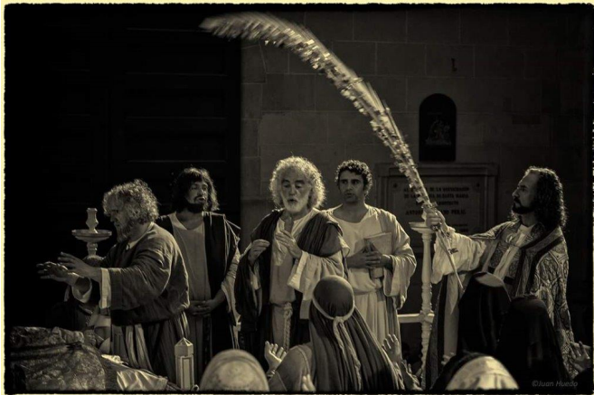
San Pedro bautiza a los judíos.