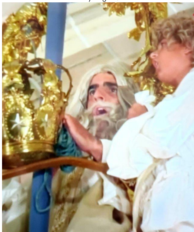
Cantando el "Vos siau ben arribada", justo antes de la Coronación de la Virgen.