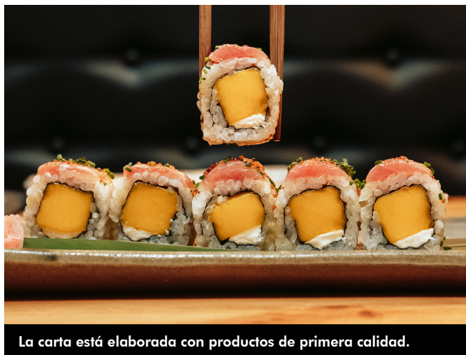
La carta está elaborada con productos de primera calidad.

La "experiencia Sibuya" que ahora llega a Elda propone un viaje por la innovación y la variedad, con una carta elaborada con productos de primera calidad procedentes de proveedores selectos, pensada tanto para clientes atrevidos como tradicionales, y con posibilidades para los más sanos o para los amantes de las salsas. Y todo ello con un ticket medio de 25 euros, asequible a todos los bolsillos.