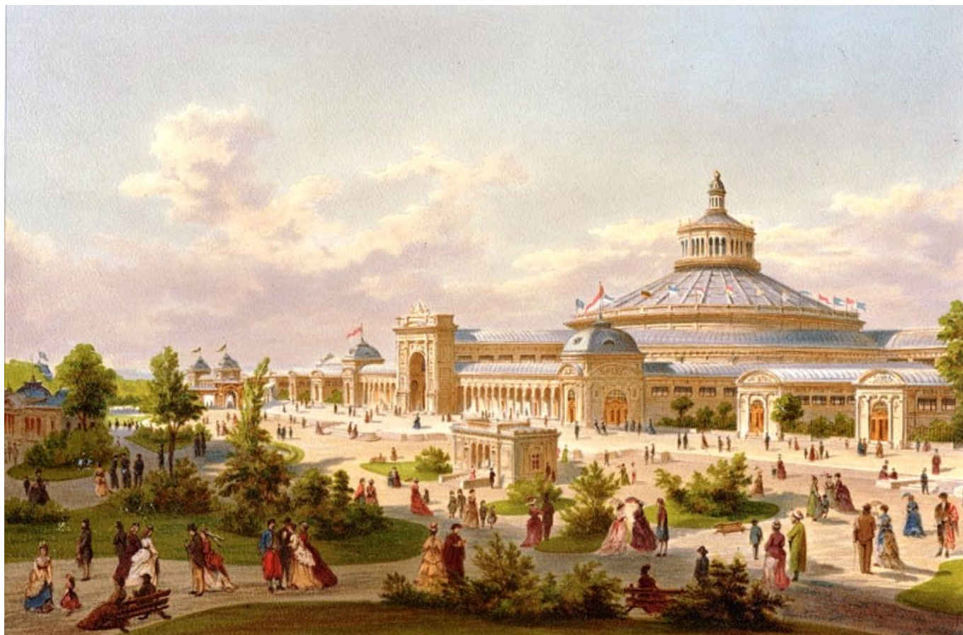
Vista del recinto ferial de la Exposición Universal de Viena, 1873

Larga es la historia de la presencia de los productos eldenses en el comercio internacional. Para encontrar la primera referencia nos debemos remontar al siglo XIX.