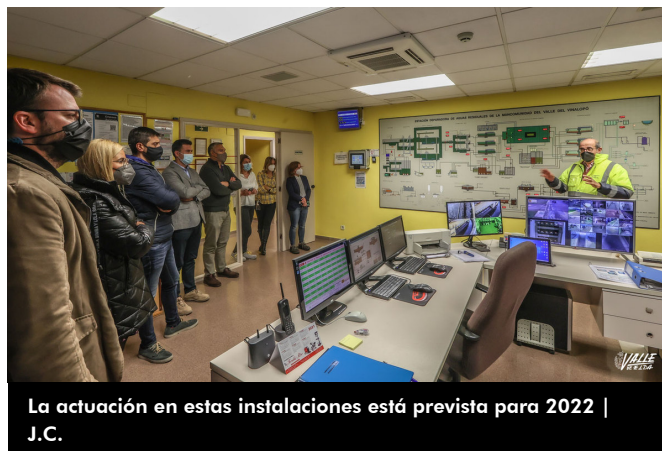
La actuación en estas instalaciones está prevista para 2022