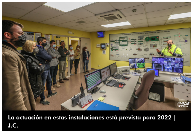
La actuación en estas instalaciones está prevista para 2022