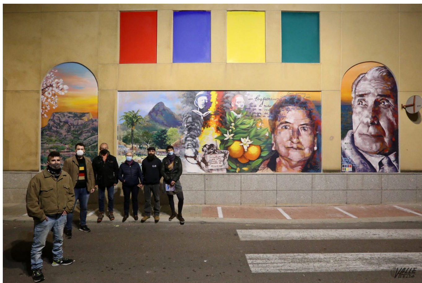
El mural ya luce en la calle Luis Chorro.

La imagen del poeta petrerense Paco Mollá ya preside parte de la fachada de la biblioteca que lleva su nombre, en la calle Luis Chorro . Esta obra constituye un nuevo homenaje a la figura del relevante escritor en la localidad. Este proyecto, encargado por la Concejalía de Cultura de Petrer , se presentó ayer con un recital poético a cargo de ArtenBitrir .