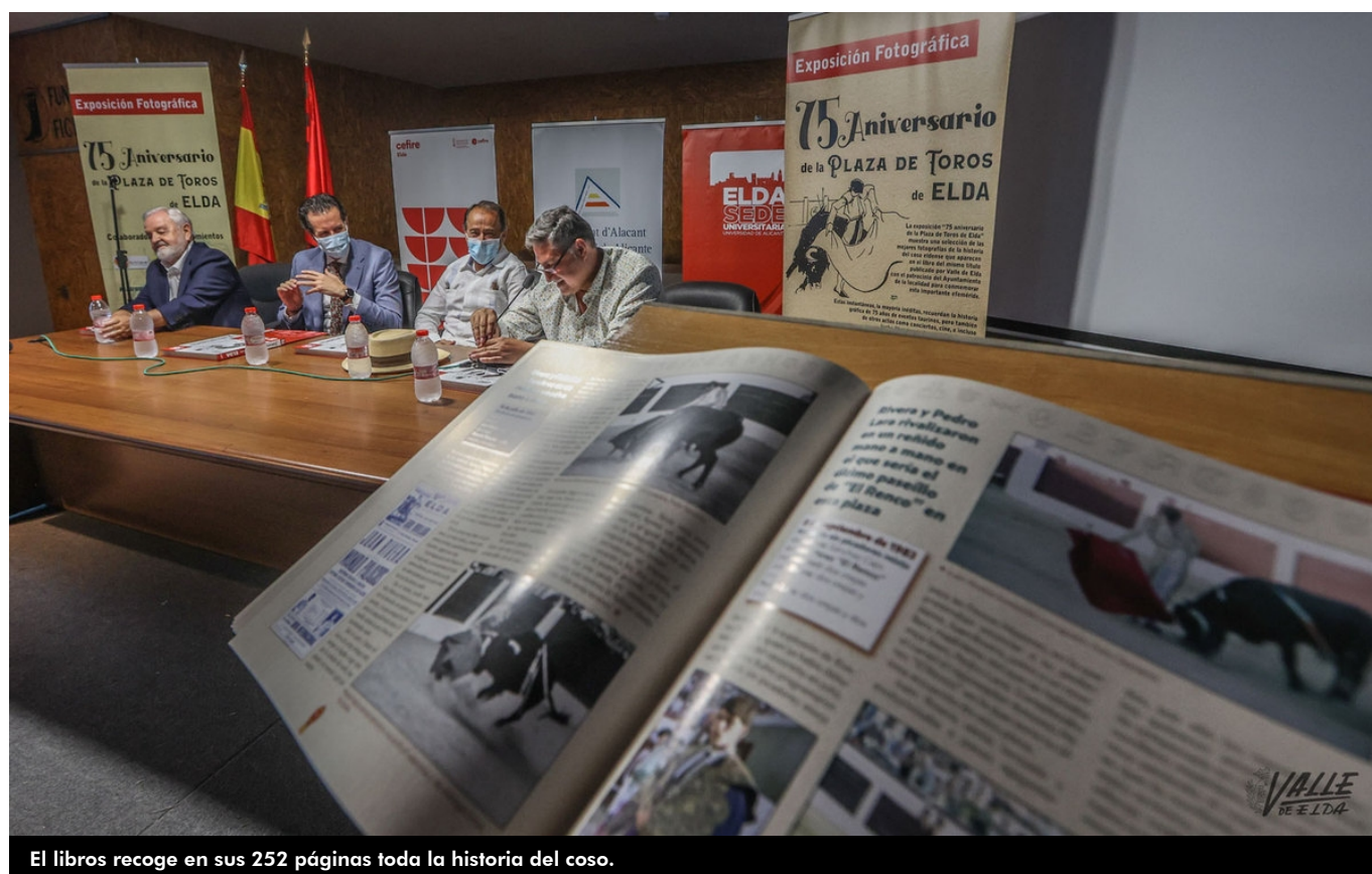
El libro recoge en sus 252 páginas toda la historia del coso.