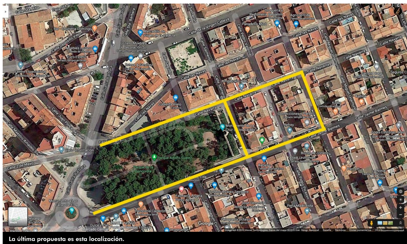
La última propuesta es esta localización.