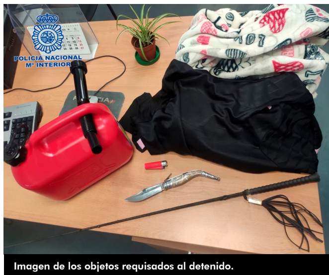
Imagen de los objetos requisados al detenido.

Se ha hecho cargo de la investigación el grupo de la UFAM de la Comisaría de Policía Nacional de Elda para esclarecer todo lo ocurrido e informar a la Autoridad Judicial.