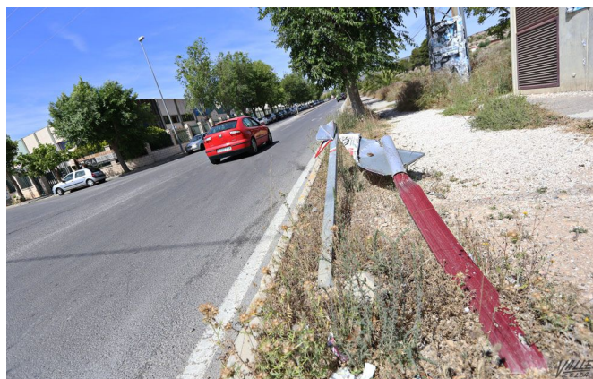
Algunas señales de tráfico permanecen caídas | Jesús Cruces.

El concejal de Mantenimiento ha aclarado que se encuentran a la espera de que salga a licitación la nueva contrata de limpieza de la ciudad, dotada con más de un millón de euros anuales, pero debido a los plazos que hay que cumplir administrativamente, no cree que esté lista hasta después de los meses de verano, pues requiere un periodo de exposición pública de 50 a 60 días. Gómez cree que el problema arranca del año 2012 cuando el gobierno del Partido Popular redujo el contrato de limpieza viaria en 700.0000 euros, "entonces se perdió personal y servicios".