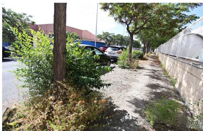
Los usuarios están molestos con la situación | Jesús Cruces.

Una muestra de la falta de civismo se aprecia diariamente en toda la ciudad, pues es frecuente, ver que la gente arroja papeles y colillas al suelo pese a tener papeleras cerca. Mención especial merecen los propietarios de mascotas que dejan que sus perros hagan sus necesidades por cualquier lugar de la ciudad, incluido el pipí de los perros que deja manchas considerables en el asfalto, como se aprecia en la Plaza del Ayuntamiento, pues se olvidan que hay que llevar a los perros a hacer sus necesidades junto a los imbornales y echar agua a continuación.