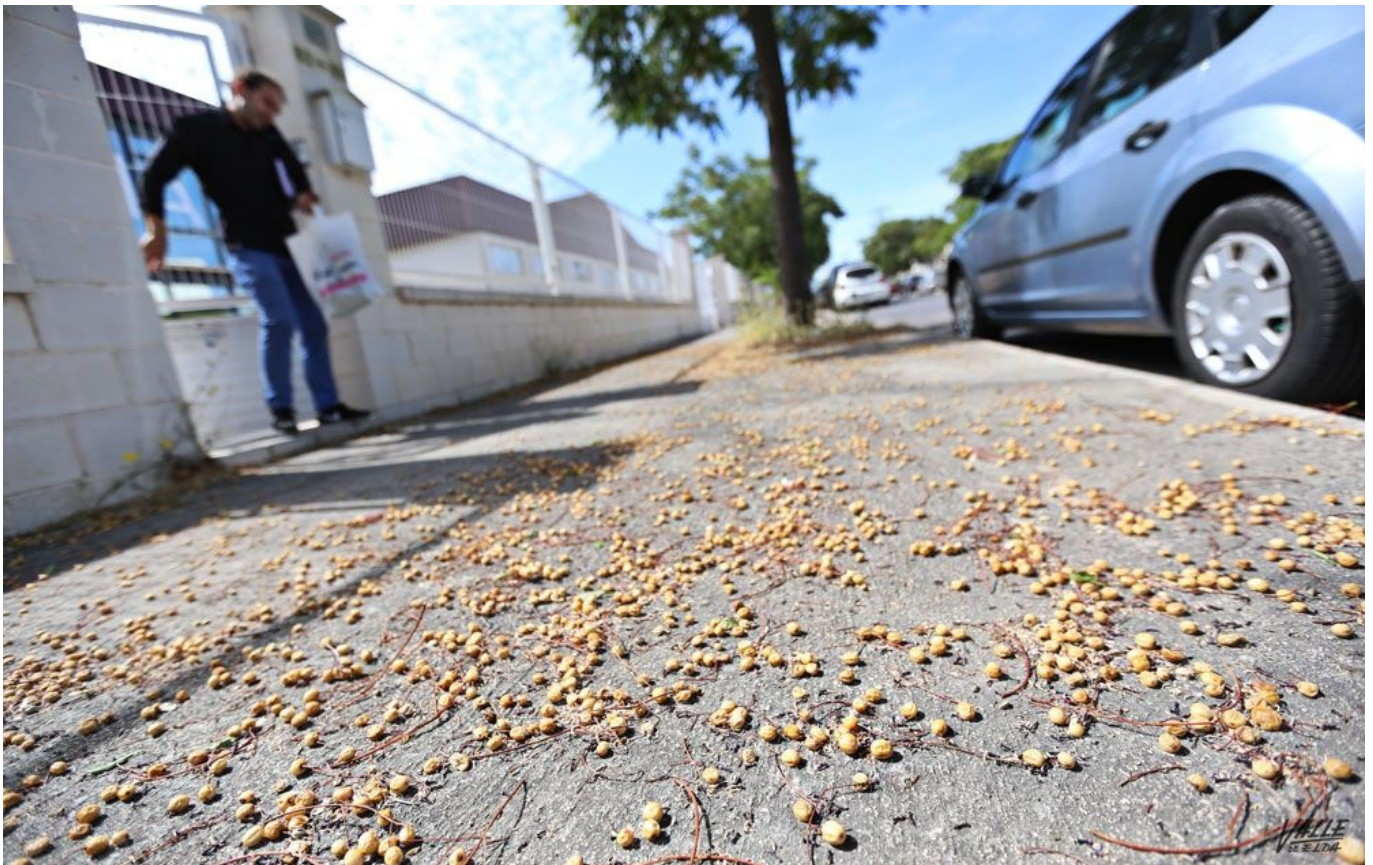
Los frutos del suelo provocan resbalones