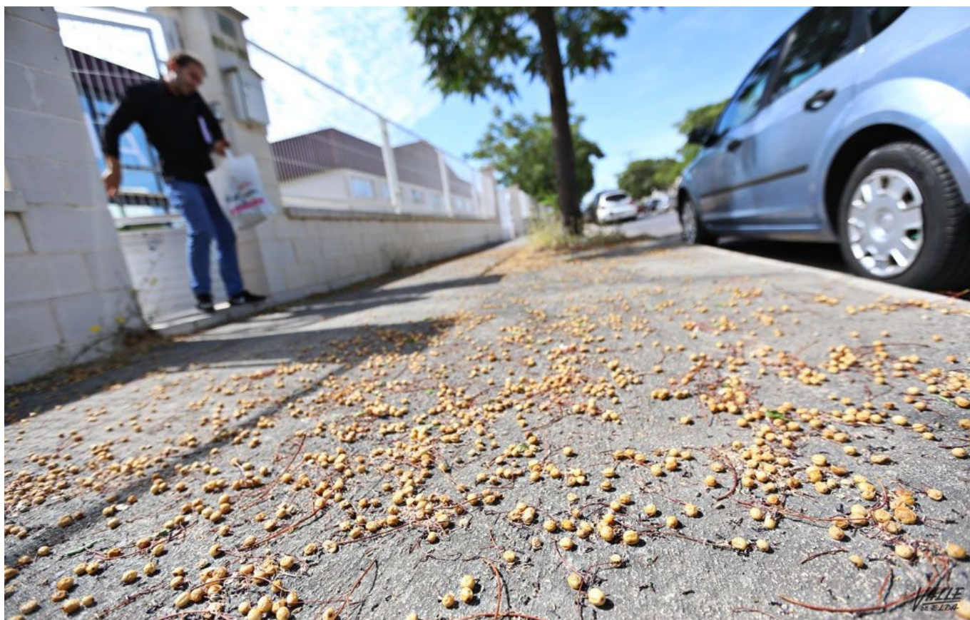
Los frutos del suelo provocan resbalones