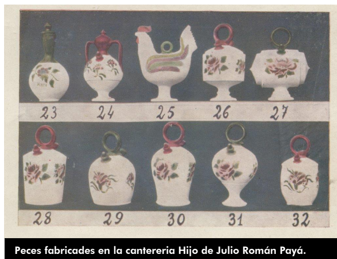
Peces fabricades en la cantereria Hijo de Julio Román Payá.