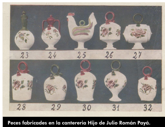
Peces fabricades en la cantereria Hijo de Julio Román Payá.