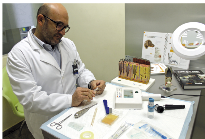
La Clínica se encuentra en la calle Ramón Gorgé, 22 de Elda.

Sí, la Clínica Veterinaria Manjón comenzó su andadura en Elda hace más de una década, aunque gracias a la incorporación de este nuevo servicio podríamos decir que ahora iniciamos una nueva etapa con el objetivo de ofrecer esta especialización en toda la comarca mediante la consulta propia, pero también en colaboración con otros centros.