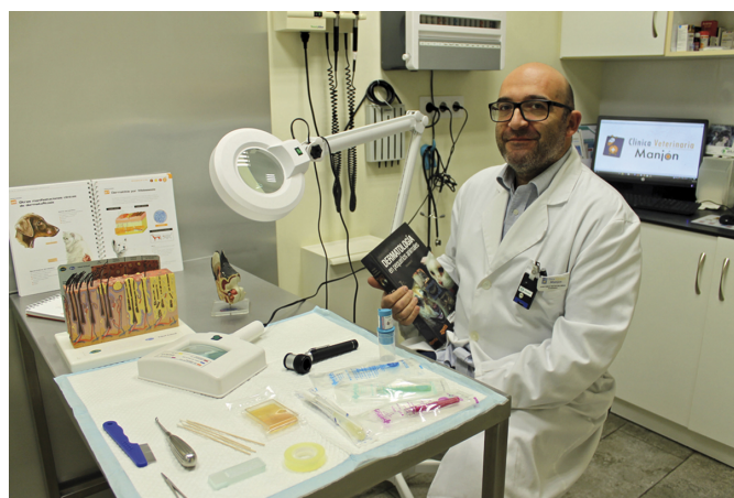
La clínica ofrece un servicio dermatológico exclusivo en la comarca.

Intentamos utilizar fármacos novedosos que presenten menos efectos secundarios para las mascotas y hacemos un mayor uso de la champúterapia. Además, cada vez se usan más vacunas frente a los procesos alérgicos. También existen tratamientos nuevos que nos permiten tratar procesos parasitarios de la piel de forma más segura para el animal y el propietario. En realidad cada vez disponemos de más tratamientos específicos y variados para tratar y diagnosticar los problemas de la piel.