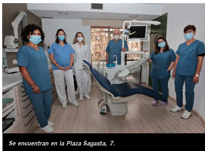
Se encuentran en la Plaza Sagasta, 7.

Recordamos que en la Clínica Dental Doctor Garrido cumplen con todos los protocolos COVID-19, garantizando su seguridad y la de su sonrisa. Se encuentran en Plaza Sagasta, 7, de Elda, su teléfono es el 965 392 952 y su web www.doctorgarrido.com .