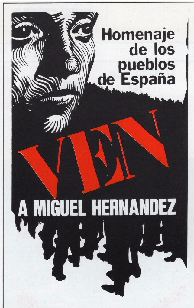
Cartel del Homenaje de los pueblos de España. Año 1976.

De que los ayuntamientos democráticos de Petrer, desde el primero hasta el último, han apoyado siempre la cultura no existe ninguna duda. Y como una parte importante de la misma, la poesía. Buena prueba de ello son los numerosos poemarios editados por el Ayuntamiento y los Premios nacionales de poesía Paco Mollá en castellano y en valenciano que prestigian a Petrer desde el año 1981 en una fuerte apuesta por esas composiciones literarias que llamamos poemas y que se conciben como expresión artística de los sentimientos por medio de la palabra.