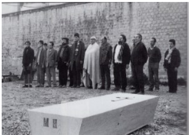
Recreación del entierro del poeta universal en la cárcel de Alicante con motivo del video realizado por Boni Navarro y Avelino Martínez.

transportándolos de nuestros corazones al espacio; eran noches mágicas que anidaban poemas en las entrañas que rescataba versos del olvido.