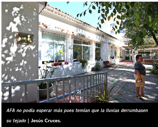
AFA no podía esperar más pues temían que la lluvias derrumbasen su tejado | Jesús Cruces.

Orovio ha explicado que se han estudiado varios emplazamientos en Elda para AFA, como el edificio de preescolar del antiguo colegio El Seráfico, pero ninguno estaba adaptado a sus necesidades. Por suerte, afirma, "Sense Barreres ha tenido la amabilidad de ayudarnos".