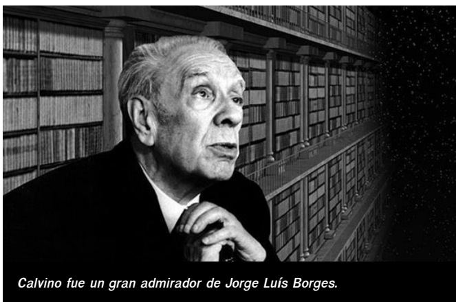
Calvino fue un gran admirador de Jorge Luís Borges.