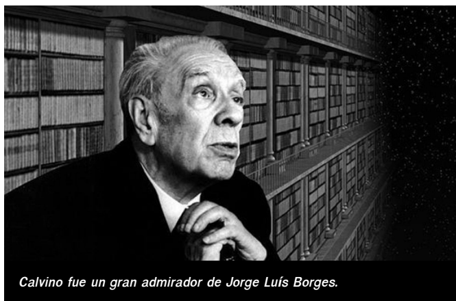
Calvino fue un gran admirador de Jorge Luís Borges.