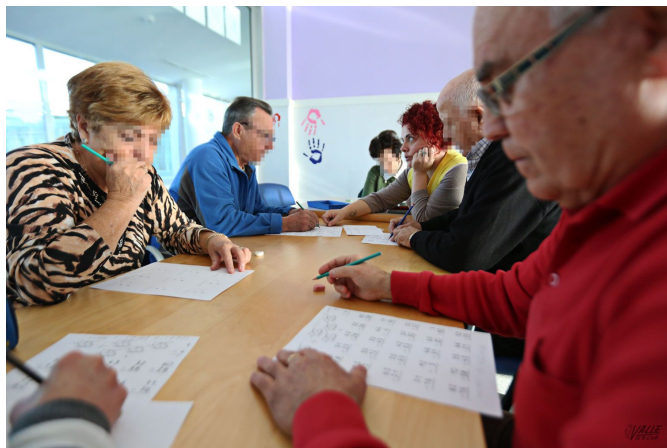
Imagen de uno de los talleres de AFA | Jesús Cruces.