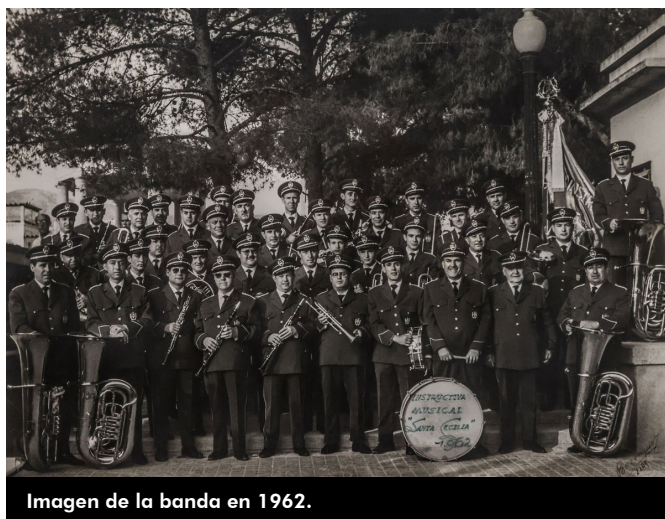
Imagen de la banda en 1962.

La pandemia no ha evitado que la escuela de la banda continúe, así como los ensayos. La música de la Santa Cecilia no deja nunca de escucharse y solo se conoce un periodo en el que no tocase, durante la Guerra Civil.