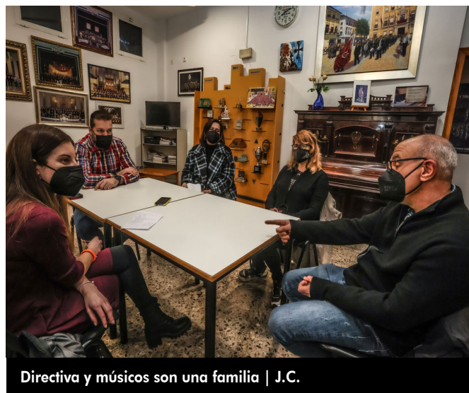
Directiva y músicos son una familia