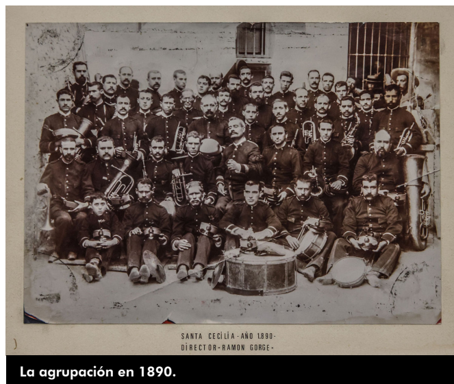
La agrupación en 1890.