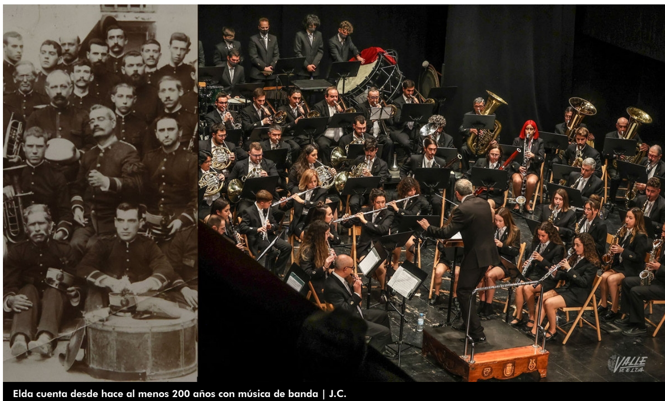
Elda cuenta desde hace al menos 200 años con música de banda | J.C.

La cultura eldense y la AMCE Santa Cecilia son inseparables. La banda está presente en todos los actos importantes de la ciudad para ponerle música a cada ocasión especial. Este año la agrupación celebra sus 200 años, dos siglos en los que Elda ha contado con banda musical.