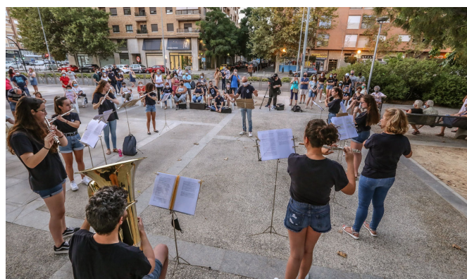
La escuela asegura el futuro de la banda | J.C.

Elda tiene asegurada el futuro de la música de banda para muchos años más, concluyen desde la agrupación.