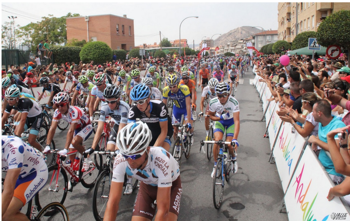
Imagen de archivo de la Vuelta Ciclista en 2011.

La tercera etapa de la Vuelta Ciclista a España 2019 pasará por Elda y Petrer mañana lunes sobre las 14,30 horas, por lo que sendos ayuntamientos han activado un Plan de Emergencias. Además, a lo largo el trayecto de los siete kilómetros por el término municipal de Elda se instalarán 12 zapatos gigantes de Inescop para que puedan verse en toda España a través de las televisiones, al igual que en Petrer colocarán un gran mural de ganchillo en su fortaleza. Esta etapa partirá desde Ibi y tendrá la meta en Alicante. La caravana publicitaria y de asistencia a los equipos se estima que llegará previamente a Elda pasadas las 12,30 horas, por lo que desde las 10 horas no se podrá aparcar en determinadas