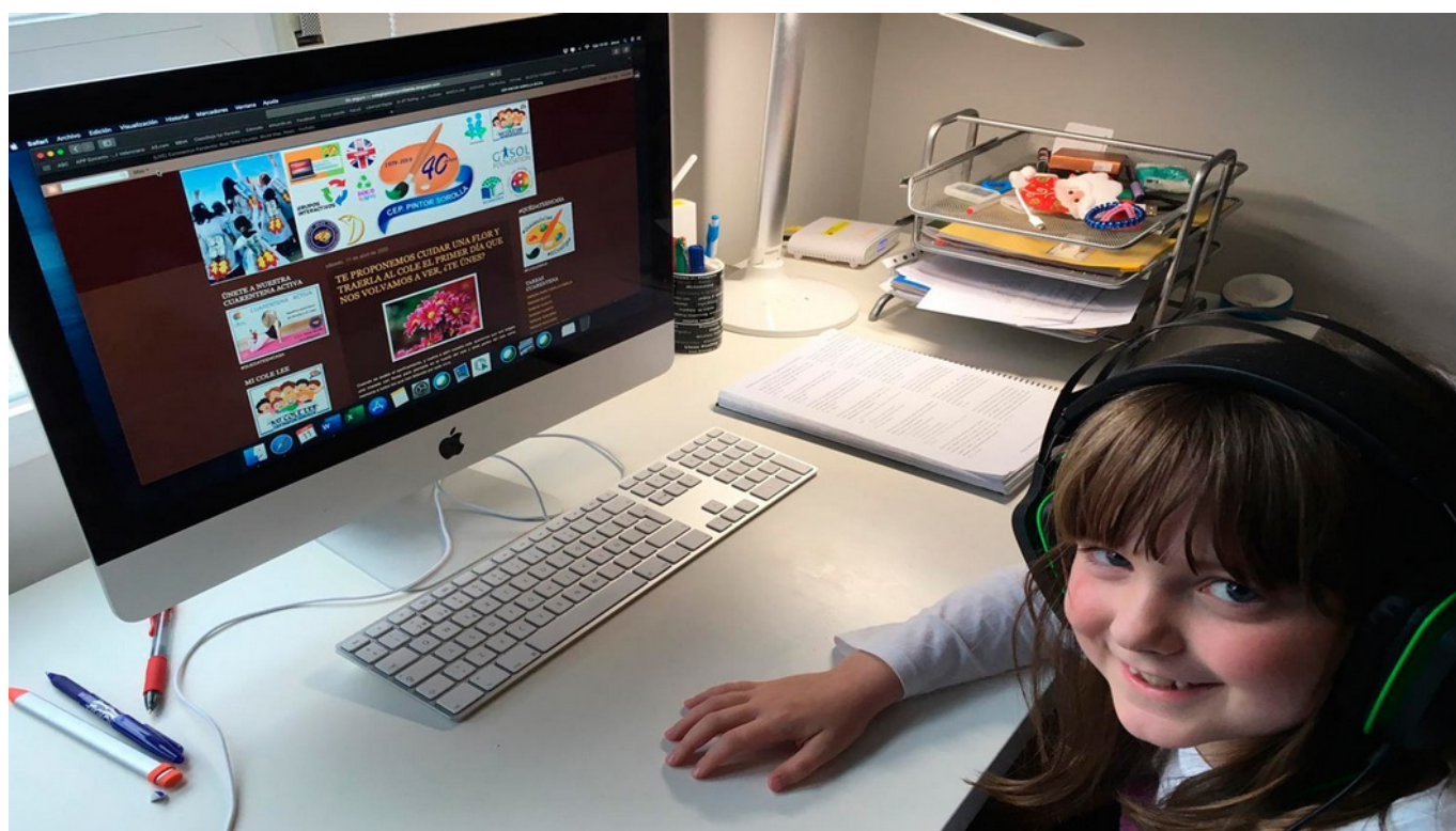
Los alumnos están enviando su material.

El profesorado del colegio público Pintor Sorolla de Elda está poniendo en marcha durante esta cuarentena su propia radio, Sorolla FM . Durante el aislamiento serán los profesores quienes realicen los programas con audios que envíen los alumnos contando su experiencia durante esta crisis sanitaria .