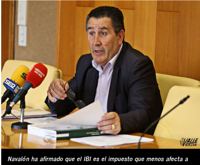
Navalón ha afirmado que el IBI es el impuesto que menos afecta a

El resto de tasas, tales como la de exámenes, cementerios, bodas, basura o apertura de negocios y Oficina Técnica seguirán su carácter continuista, mientras que la tasa de mercados se encuentra todavía en fase de estudio.