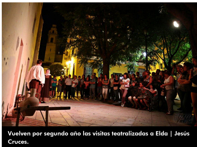
Vuelven por segundo año las visitas teatralizadas a Elda | Jesús Cruces.

También en la programación encontramos actuaciones específicas para los más pequeños, que tendrán lugar los miércoles a las 8 de la tarde. El día 5 se representará el espectáculo Duendes y Zancudos en los jardines de Nueva Fraternidad, el día 12 es el turno del cuentacuentos La magia del disparate en la Asociación de Vecinos Virgen de la Salud, el 19 en la Plaza Castelar el cuentacuentos Siete duendes del mundo y por último, el día 26 se presentará la verbena infantil La nena crea, en el jardín anexo al Centro Social Severo Ochoa.