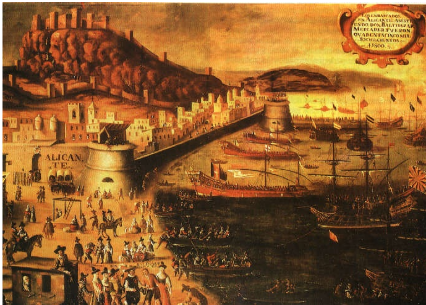
Vista de la ciudad y castillo de Alicante en 1609