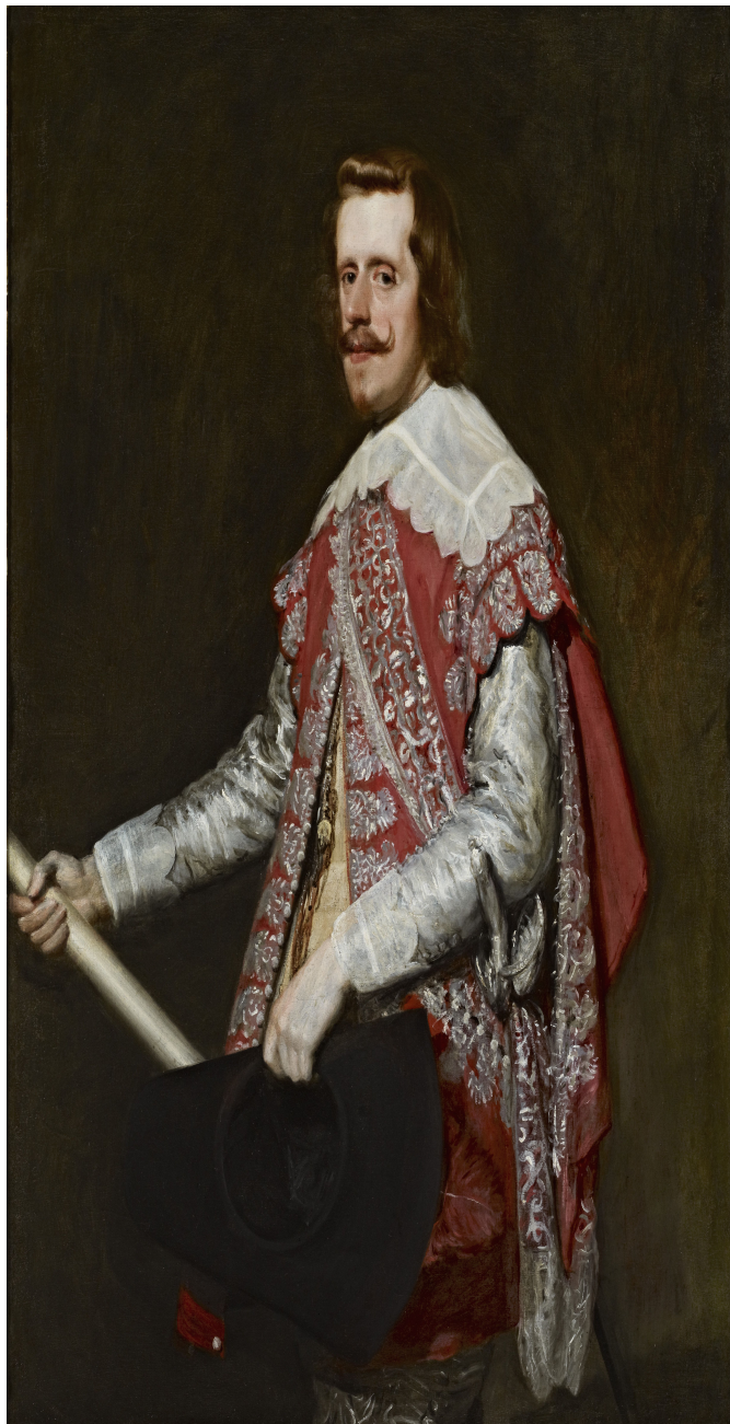
Retrato de Felipe IV pintado por Diego de Velázquez en 1644