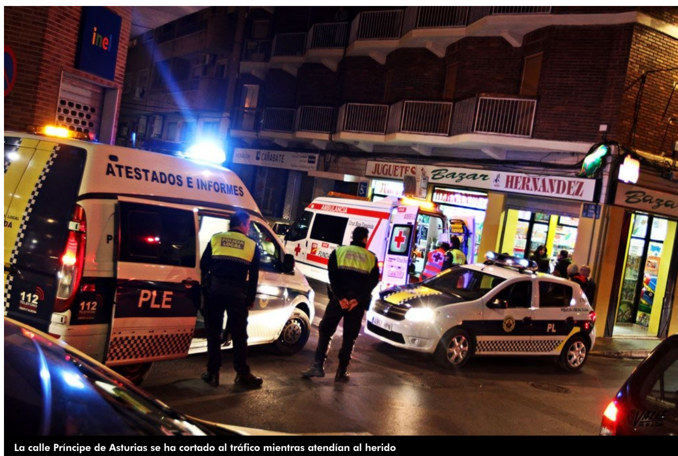
La calle Príncipe de Asturias se ha cortado al tráfico mientras atendían al herido

Un hombre ha resultado herido esta tarde al ser atropellado mientras atravesaba, pasadas las 19 horas, el paso de peatones situado en el cruce entre las calles Príncipe de Asturias y Pedrito Rico . El herido, un hombre de avanzada edad, según fuentes policiales, sufría heridas de carácter grave y ha sido trasladado al Hospital General Universitario de Elda donde ha sido ingresado.