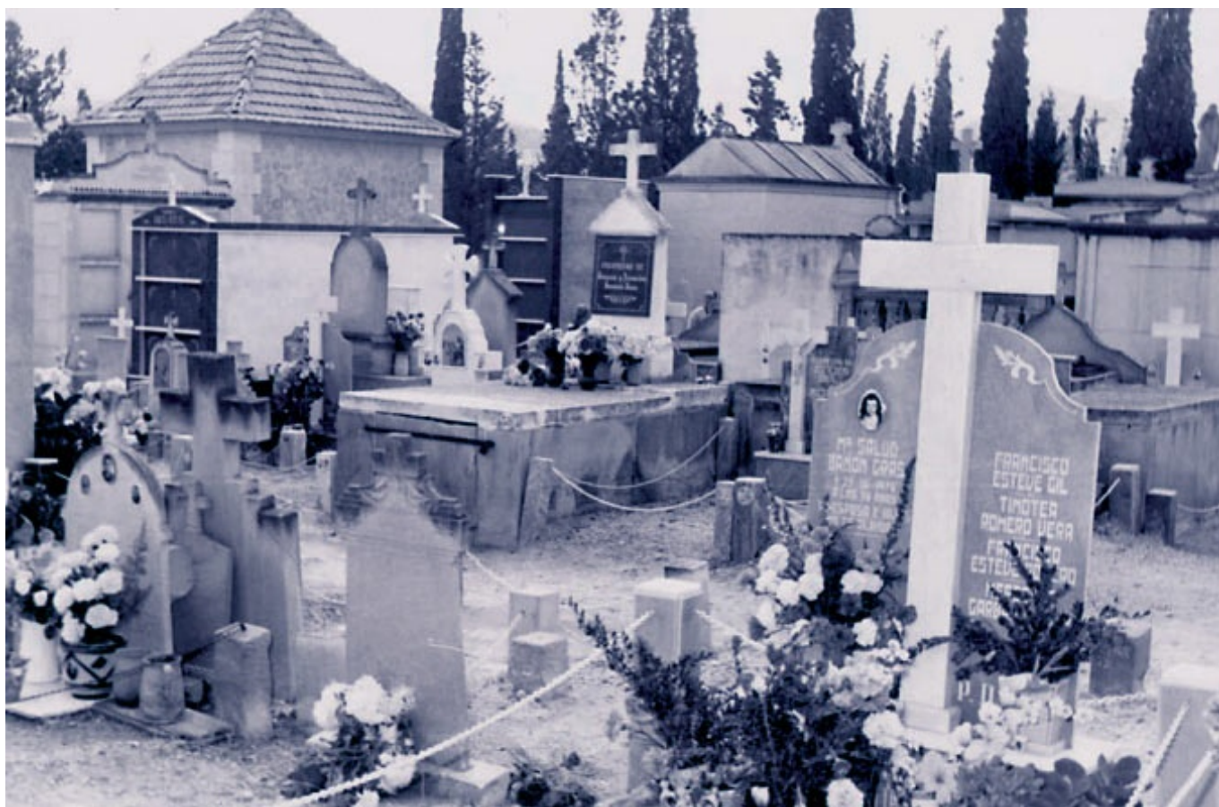
Cientos de eldenses fallecieron por al epidemia del cólera.

Nos encontramos en pleno siglo XXI y la mayoría de los eldenses y del mundo civilizado nunca hubiéramos imaginado que a estas alturas nos afectaría una pandemia tan grave como la que estamos sufriendo en todo el planeta. Pensábamos que cualquier epidemia mortal formaba parte solamente del pasado o del denominado Tercer Mundo, hasta que apareció este inesperado COVID-19, el cual nos ha demostrado que a pesar de todos los avances médicos y sanitarios actuales, su efecto es devastador. No distingue entre clases sociales, países o razas, y ha contagiado mundialmente a millones de personas y provocado la muerte a cientos de