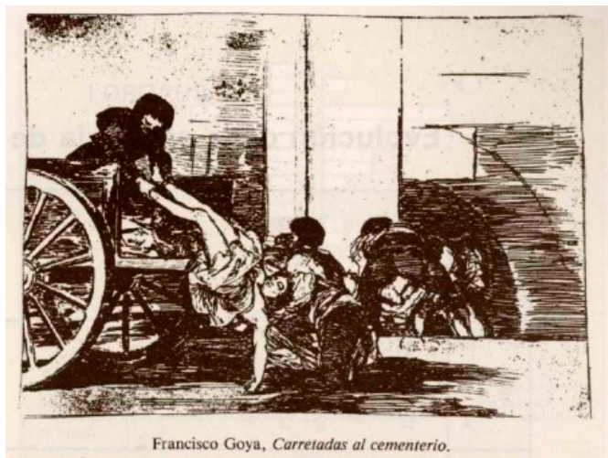
Francisco Goya, Carretadas al cementerio .

Carretas al cementerio (Grabado de Goya)