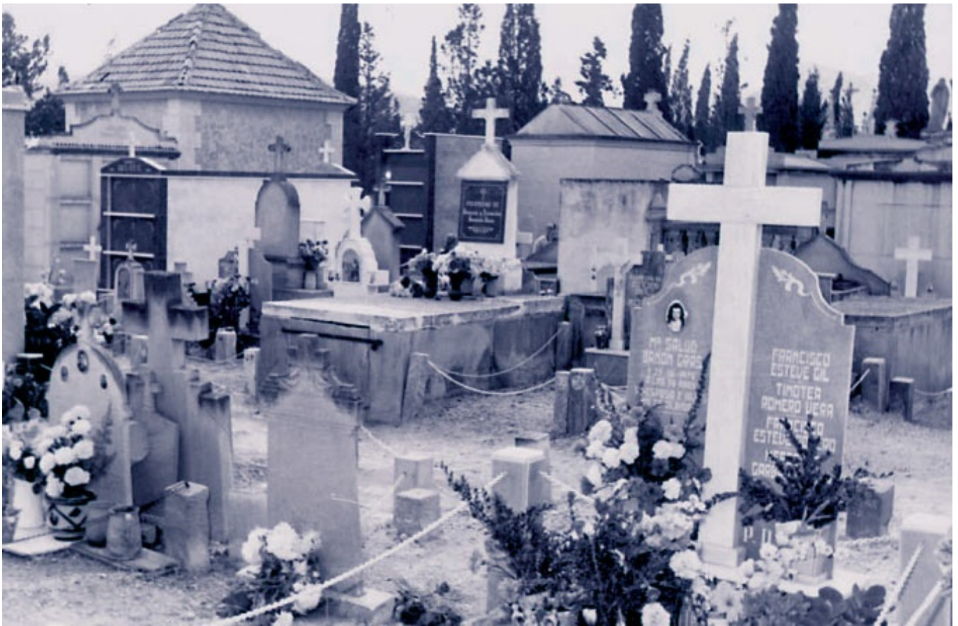
Cientos de eldenses fallecieron por al epidemia del cólera.

Nos encontramos en pleno siglo XXI y la mayoría de los eldenses y del mundo civilizado nunca hubiéramos imaginado que a estas alturas nos afectaría una pandemia tan grave como la que estamos sufriendo en todo el planeta. Pensábamos que cualquier epidemia mortal formaba parte solamente del pasado o del denominado Tercer Mundo, hasta que apareció este inesperado COVID-19, el cual nos ha demostrado que a pesar de todos los avances médicos y sanitarios actuales, su efecto es devastador. No distingue entre clases sociales, países o razas, y ha contagiado mundialmente a millones de personas y provocado la muerte a cientos de