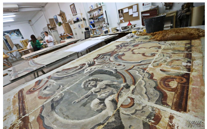
La pintura durante el proceso de restauración a través de la metodología Strappo