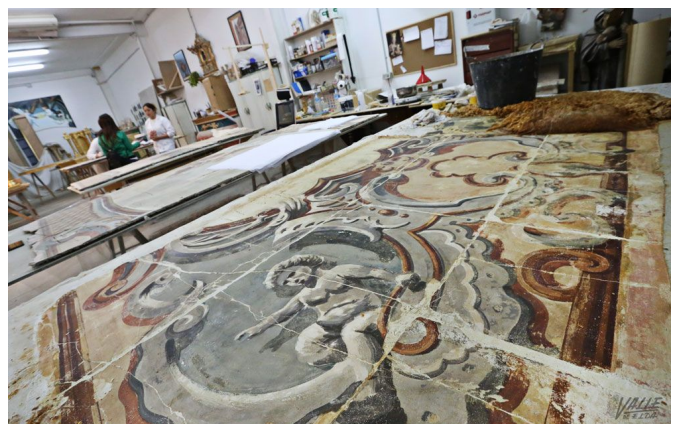
La pintura durante el proceso de restauración a través de la metodología Strappo