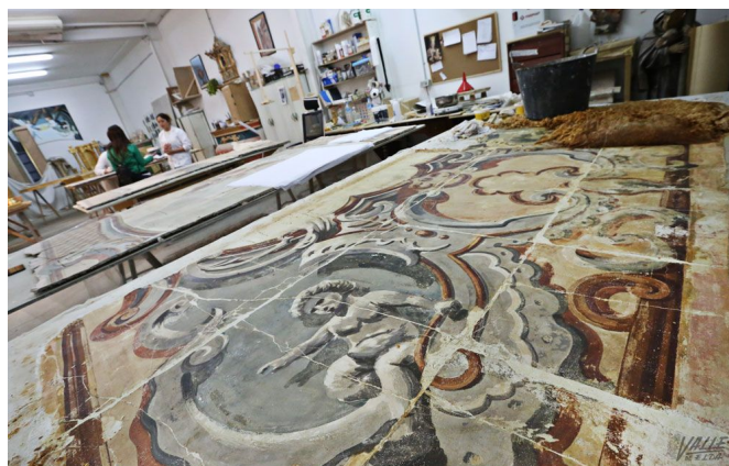
La pintura durante el proceso de restauración a través de la metodología Strappo