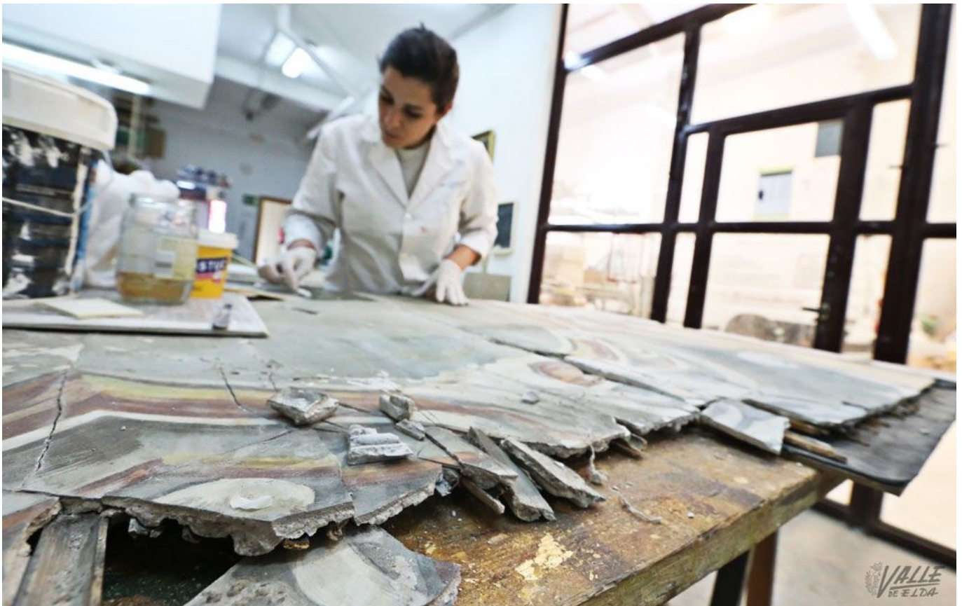
Se ha trabajado en el mural durante siete meses | Jesús Cruces.

Los eldenses que visiten desde el próximo jueves el Ayuntamiento de Elda podrán disfrutar de una obra de arte . Se trata de una pintura mural fechada en 1907 de 20 metros cuadrados, de seis metros de largo por 2,75 metros de ancho. El Taller religioso Julián del Olmo está trabajando en la pintura del artista alicantino Bernardo Carratalá para recuperarla e instalarla en el vestíbulo del Consistorio , como adelantó hace unos meses Valle de Elda .