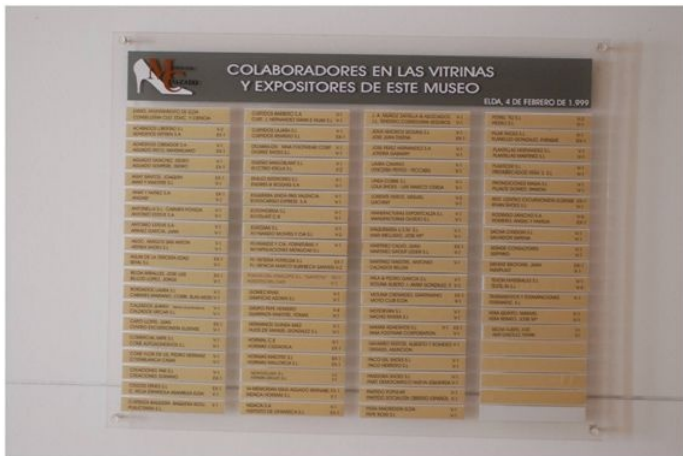
Directorio con el nombre de los donantes de vitrinas al Museo y su lugar de ubicación.

A unos meses escasos para proceder a la inauguración del Museo del Calzado en el actual emplazamiento, a finales de 1998, no disponíamos de una sola vitrina para poder exponer las piezas . Hice un estudio sobre la cantidad de expositores necesarios y las cifras eran demoledoras. Nada menos que alrededor de 150 vitrinas. Eso equivalía a un importe en pesetas muy elevado, suponían alrededor de 22 millones de las antiguas pesetas (132.000 \square ). ¿De dónde sacarlas? ¿A quién recurrir?