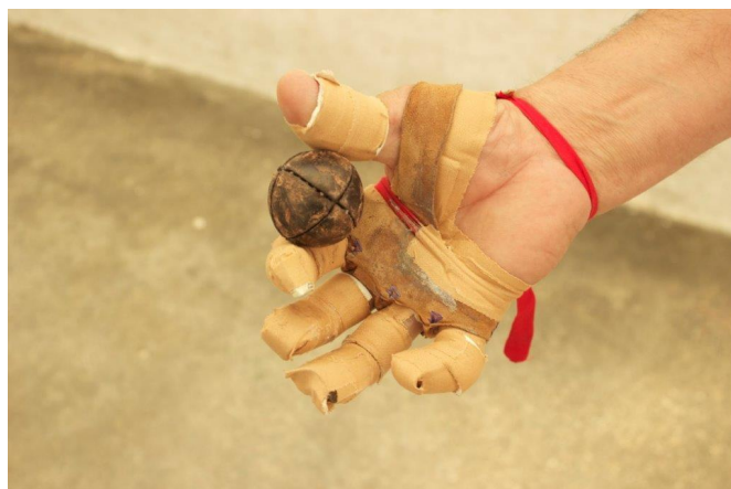
Pilota de vaqueta.

El periodista esportiu conclou la seua detallada crònica amb una observació: "Por espacio de tres días se han visto juntas más de cuatro mil personas, agitadas en una pequeña población para presenciar un espectáculo inocente al par que interesante, cada jugada maestra, cada pelota lanzada con brío, era saludada con estrepitosa gritería; ni una herida, ni el menor desorden, solo aplauso a los diestros y entusiasmo por los fuertes brazos. Hemos visto con placer, no solo que la afición a este noble juego se mantiene viva, sino también que la autoridad lo protege con la fuerza pública".