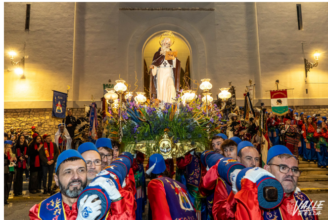
Los Moros Realistas portan este año a San Antón | Nando Verdú.

Pasadas las 19 horas arrancó el traslado iniciado por el bando de la cruz seguido por el de la media luna. Con ropa de calle, pero con los distintivos de las comparsas así como con la ropa conjuntada. Los festeros contagiaban sus ganas de fiesta a su paso, pues el público llenó el recorrido en una tarde con una temperatura fresca, pero agradable.