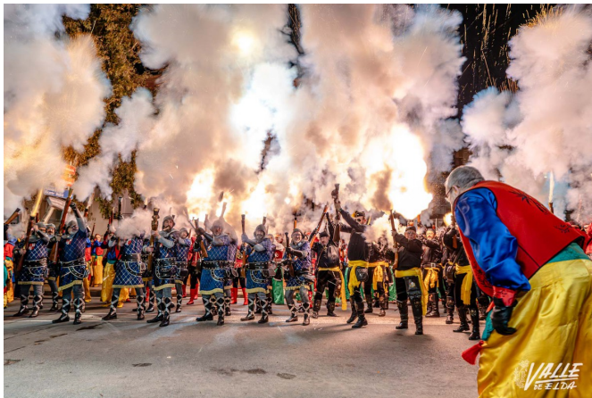
Imagen de la salva de arcabucería | Nando Verdú.

Los actos comenzaron en torno a las 17:30 horas con los disparos de arcabucería para realizar el traslado del estandarte del santo anacoreta desde la Casa de la Viuda de Rosas hasta la ermita. Durante cerca de una hora y media en gran parte de la ciudad de oían los estruendos de los arcabuces par avisar de que San Antón iba a salir a la calle. Y lo hizo portado a hombros por los Moros Realistas con una salva de arcabucería. Durante la misma hubo un incidente y varias personas resultaron heridas , pero no impidió que los actos continuaran con normalidad.