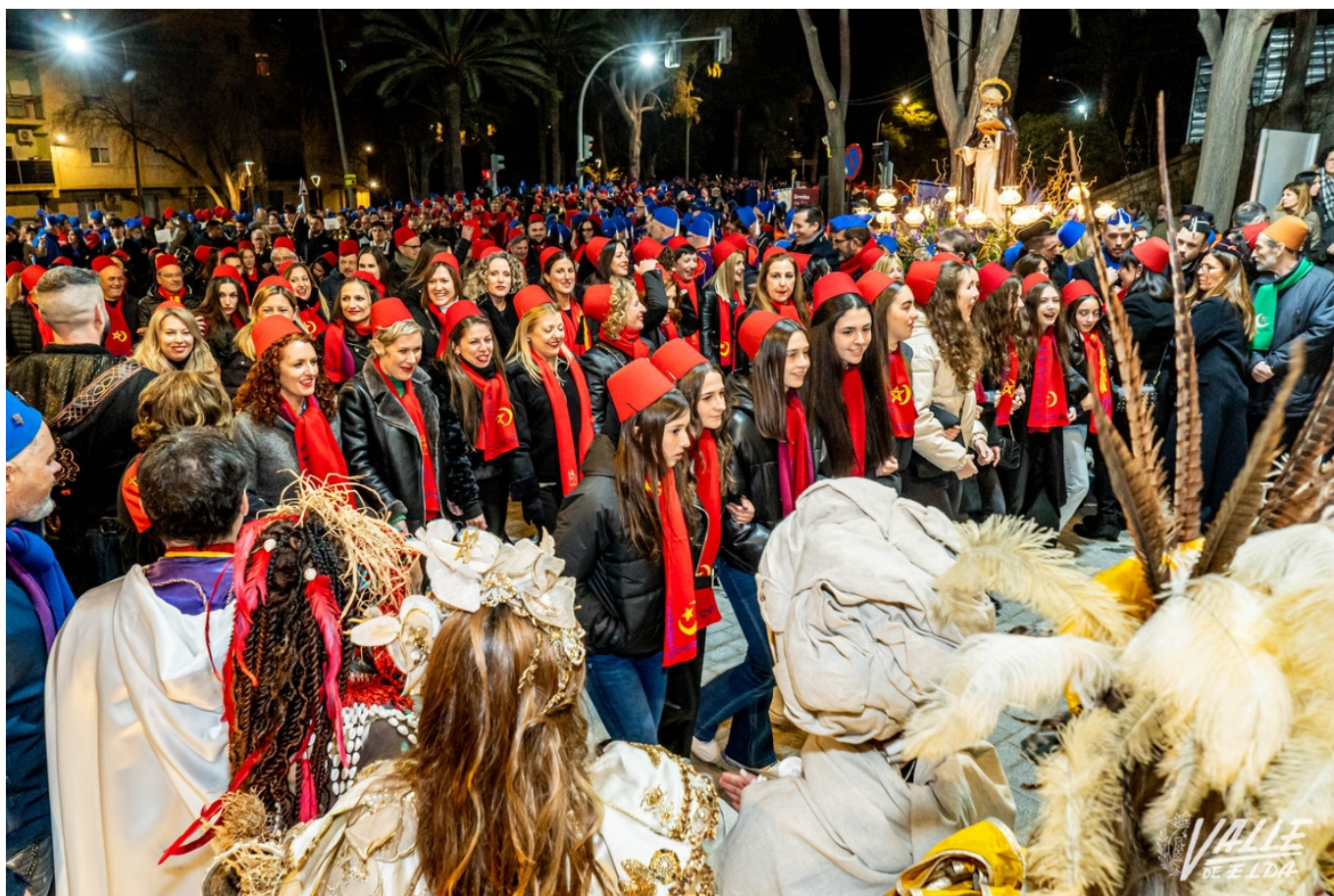
Los festeros volvieron a acompañar a San Antón | Nando Verdú.

No hay llamada a la fiesta que los eldenses no respondan. Ayer miles de festeros vivieron con pasión el multitudinario traslado de San Antón desde su ermita hasta la iglesia de Santa Ana. En honor al patrón de los Moros y Cristianos desfilaron al son de los pasodobles con sonrisas plasmadas en sus rostros. La pólvora también fue protagonista pues numerosos tiradores volvieron a disparar los arcabuces por el santo Anacoreta.