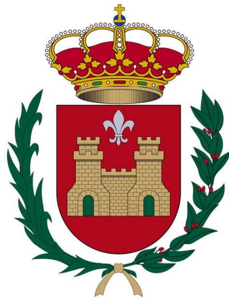
Propuesta para la normalización heráldica del escudo oficial de Elda (G.S.H)

En este sentido, y dado que el escudo de España cambió tras la aprobación de la Constitución de 1978 y la fijación del escudo oficial el 5 de octubre de 1981 , Elda tiene pendiente la modificación del timbre de su escudo para adaptarlo a la normalidad heráldica constitucional; más si cabe cuando Elda goza de la consideración de ciudad real desde que en 1841 y por sentencia del Tribunal Supremo de Justicia la villa de Elda retornó a la jurisdicción real en detrimento de la jurisdicción condal.