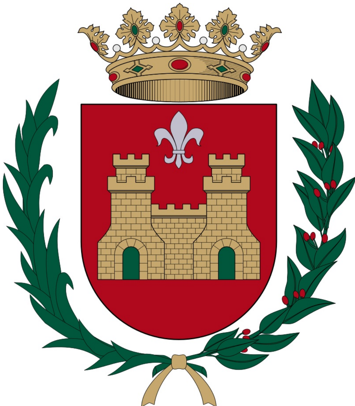
Escudo oficial de la ciudad de Elda desde el 2 de noviembre de 1965.

En la sesión del pleno municipal del Ayuntamiento de Elda del 2 de noviembre de 1965, entre otros asuntos del orden del día, se aprobó, a propuesta de la alcaldía, la regulación normativa del escudo de Elda.