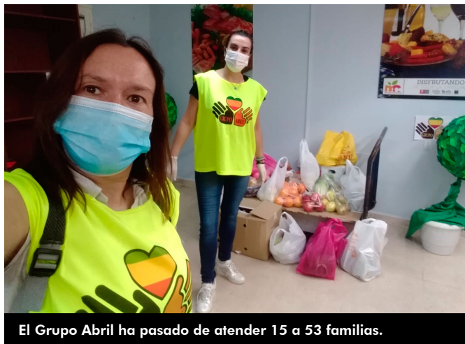
El Grupo Abril ha pasado de atender 15 a 53 familias.