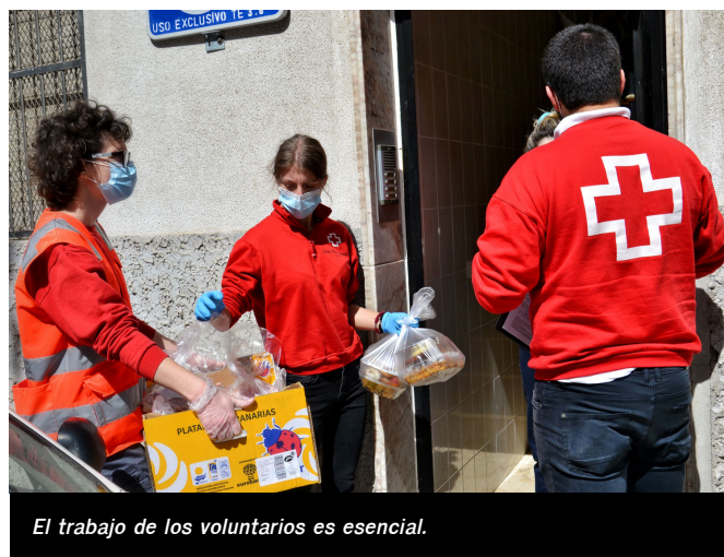
El trabajo de los voluntarios es esencial.

Este drama sanitario y económico está sacando lo mejor y lo peor de la sociedad. El lado negativo lo constituyen las personas, son las menos, que han intentado beneficiarse de más de una ayuda. El positivo, que emociona, es ver la gran cantidad de muestras solidarias de los Eldense, como un usuario de Cruz Roja que se puso en contacto con una de las trabajadoras para decirles que “si hay alguien que lo necesita más que yo, dádselo”. Desde esta ONG recalcan que le darán ayuda a todo aquel que lo necesite.