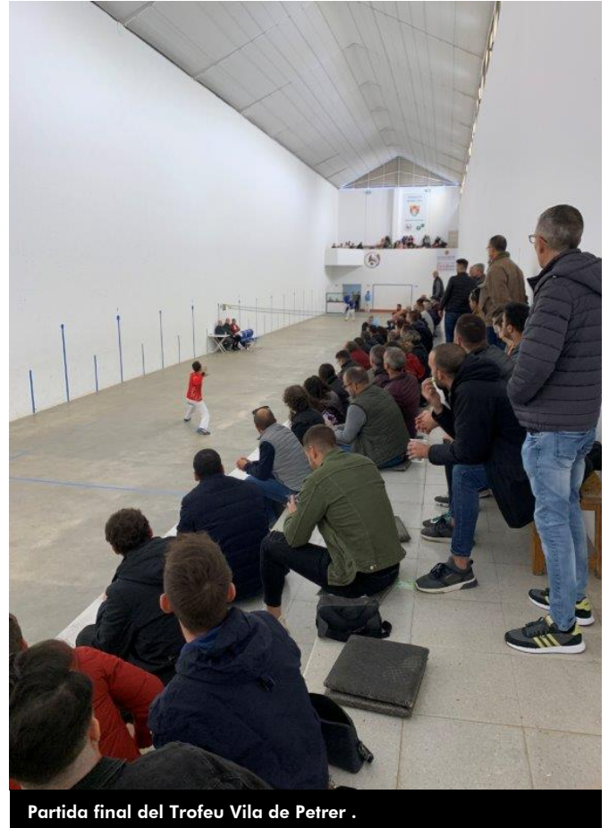
Partida final del Trofeu Vila de Petrer .