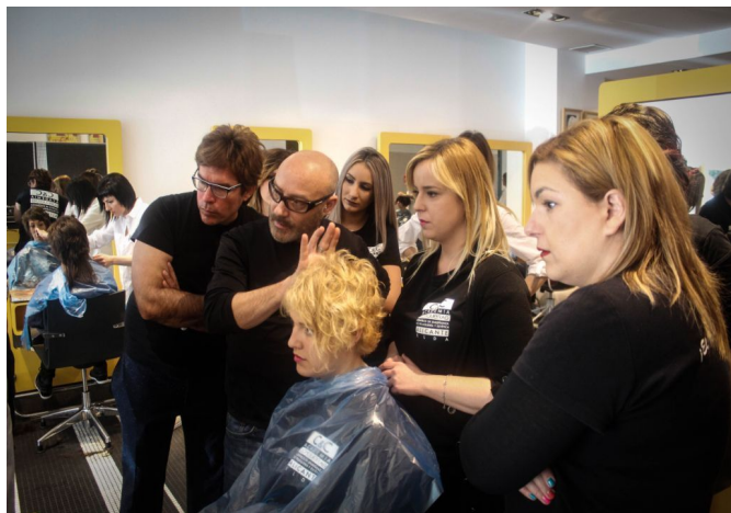
En la nueva temporada se llevarán los estilos cortos con puntas llenas y cuadradas.