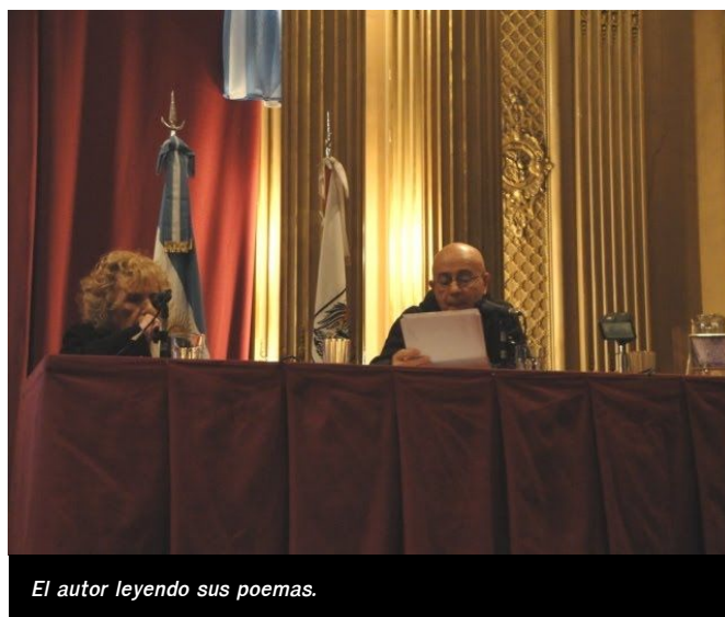
El autor leyendo sus poemas.

Nada de todo esto se encuentra lejos de sus propios poemas. Lean los textos inicial y final del poemario ya mencionado Barro desnudo , de 2016: