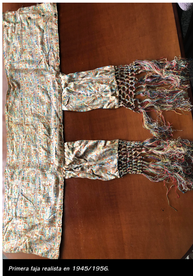
Primera faja realista en 1945/1956.