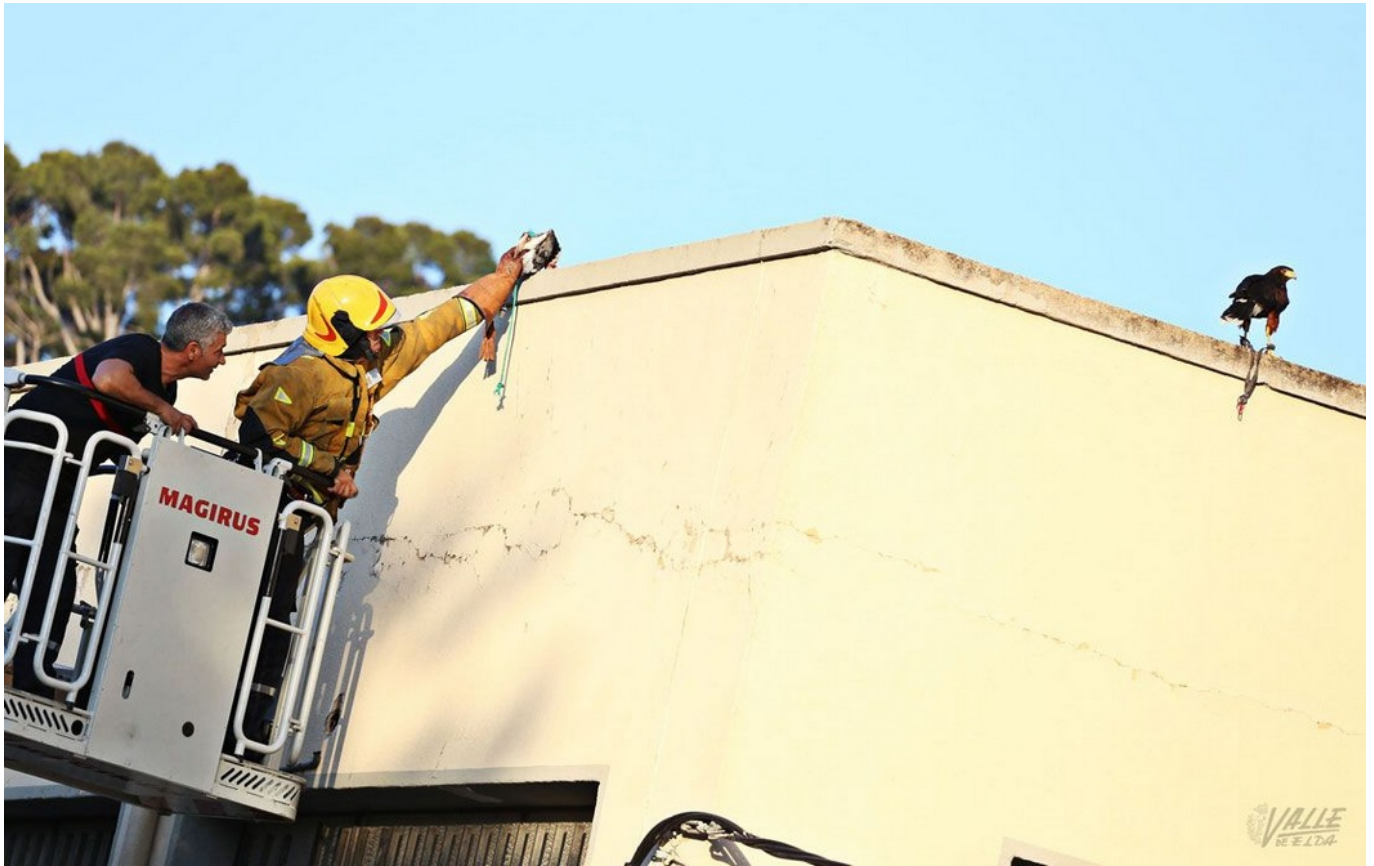
Los bomberos han tratado de llamar la atención del rapaz

Un águila harris movilizó en la tarde de ayer a varias patrullas de la Policía Local y a varios bomberos de Elda, que trataron de recuperarla sin éxito . El animal se escapó el pasado viernes y su dueño no avisó hasta poco antes de las 20 horas de la tarde de ayer. El ave se negó a atender la llamada de su dueño, un cetrero de Elda que durante casi 24 horas trató de hacerla volver y le fue imposible, por lo que desesperado buscó la ayuda de los bomberos para tratar de recuperar al ave.