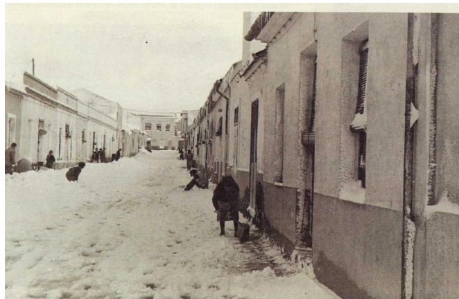
Calle Trinquete nevado en la década de los 60.

Aquel espectáculo de calles, plazas y jardines colmatadas de nieve fue inmortalizado por innumerables fotografías familiares.