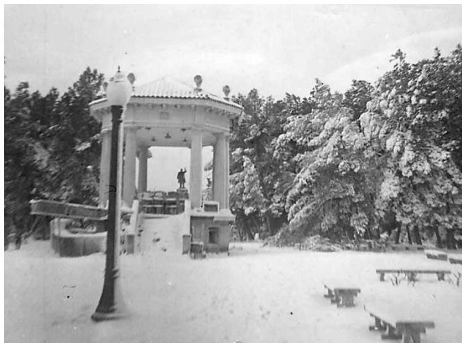
Templete de la Plaza Castelar nevado en la década de los 50.

Hasta la mañana del miércoles se interrumpió el trabajo en las fábricas, al estar cortado el fluido eléctrico, quedando cerrados los espectáculos y comercios. Ante las panaderías y carbonerías se formaron colas para conseguir pan, carbón y petróleo para cocinas y braseros, ya que aún no se utilizaba ni el gas butano y mucho menos la electricidad para la calefacción y cocinas. El servicio telefónico y telegráfico también quedó interrumpido, quedando Elda comunicada al suspenderse también el servicio regular de autobuses de