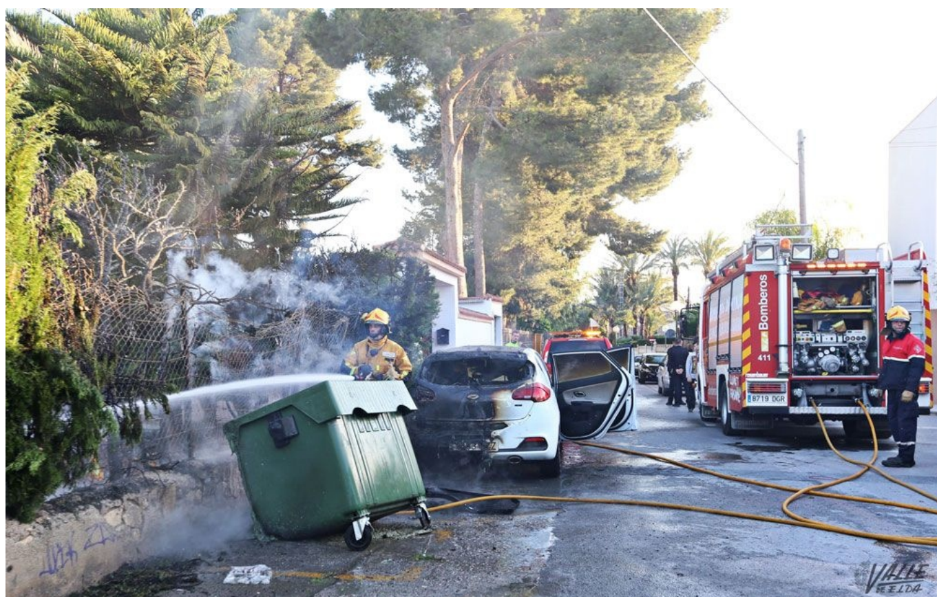
El fuego ha calcinado el vehículo | Jesús Cruces.

El incendio declarado esta tarde, pasadas las 20 horas, en calle El Campet de Petrer ha provocado daños materiales en un vehículo, un contenedor y en el seto de una casa de campo de dicha vía. La rápida actuación de los bomberos ha impedido que el fuego se extendiese, y es que muchos vecinos han temido por sus hogares , pues es una zona en la que existen numerosas casas de campo.