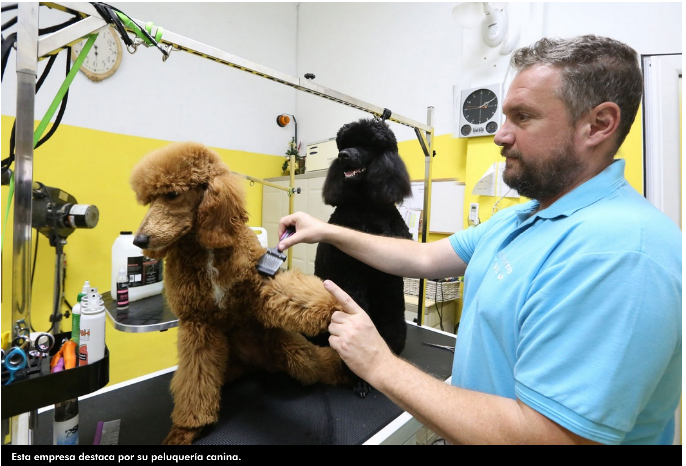
Esta empresa destaca por su peluquería canina.

Mundo Vivo se ha consolidado como la tienda de confianza especializada en peluquería canina gracias a sus excelentes profesionales especializados en cortes modernos de raza y asiáticos, a petición del cliente. Además, disponen de una zona de spa de hidroterapia con ozonoterapia para ayudar y coadyuvar los tratamientos veterinarios con otros específicos para la piel y el manto de las mascotas.