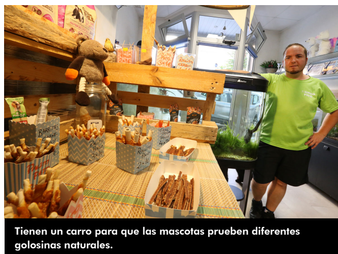
Tienen un carro para que las mascotas prueben diferentes golosinas naturales.

Y es que tienen claro que su objetivo es dar siempre a los animales de compañía lo mejor, al igual que brindar el mejor trato hacia sus clientes. Su teléfono es el 865 777 921.