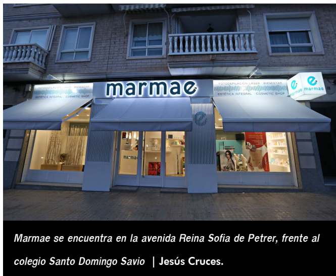
Marmae se encuentra en la avenida Reina Sofía de Petrer, frente al colegio Santo Domingo Savio.

En corporal destacan sus tratamientos anticelulíticos, piernas cansadas y reafirmantes que se suman a los servicios clásicos de depilación a la cera, manicura, pedicura, maquillaje y la posibilidad de asistir a alguno de sus cursos de automaquillaje.